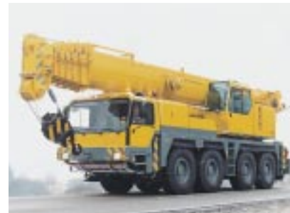
Le conducteur et le véhicule bénéficient des meilleures conditions par tous les temps

Quel que soit le modèle de véhicule ou de machine que vous utilisez, Webasto a développé des chauffages auxiliaires pour répondre aux exigences les plus pointues et satisfait ainsi aux besoins de confort de chacun.