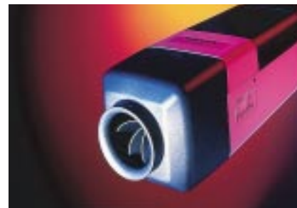
Air Top 3500 / Air Top 5000 : performant, compact et silencieux, pour des conditions d'utilisation extrêmes et des exigences des plus élevées. Peu volumineux et de montage aisé dans la cabine et dans le compartiment à marchandises.