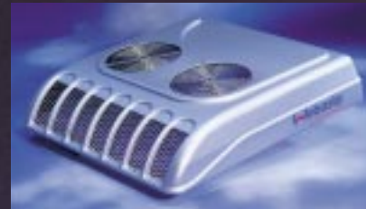
Climatisations Compact Cooler 5 et 8 : Performantes et faciles à installer

* Egalement disponible avec capteur de température externe sur demande