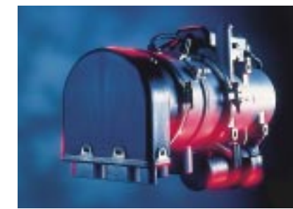
Thermo 90S : puissance calorifique élevée, réglable en continu (jusqu'à 9,1 kW), compact et facile d'entretien par un boîtier électronique intégré, niveau sonore bas et consommation électrique faible ; idéal pour toutes les exigences du quotidien.