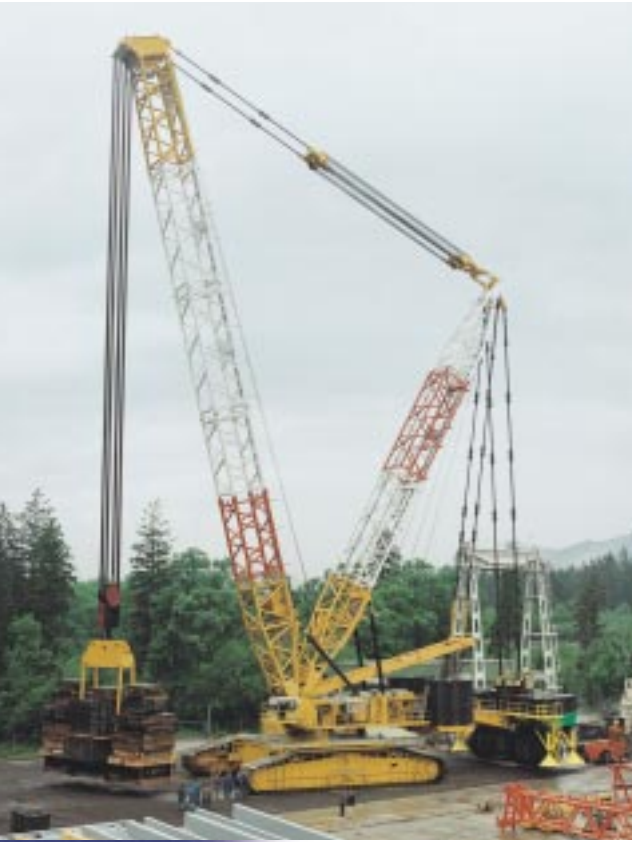
Même dans des conditions extrêmes, un chauffage auxiliaire Webasto apporte le climat optimal sur le poste de travail dans la grue.