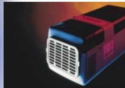
Air Top 2000 : une technologie des plus modernes de chauffage silencieux et compact pour une rentabilité optimale / thermostat d'ambiance et fonction ADR de série.

Si vous voulez uniquement chauffer confortablement l'intérieur de machines-outils, postes de conducteur et cabines, nos systèmes de chauffage à air ne constituent pas seulement une solution appropriée mais aussi une solution à prix avantageux. Il suffit de monter simplement l'appareil de chauffage compact à un endroit facile d'accès dans l'habitacle et le ventilateur de l'appareil se met déjà à aspirer l'air intérieur avant de le rendre réchauffé.