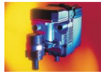
Thermo 50 : la variante à prix avantageux pour le préchauffage du moteur ou le chauffage pendant le trajet ou pour le maintien du niveau de température pendant les temps de repos.